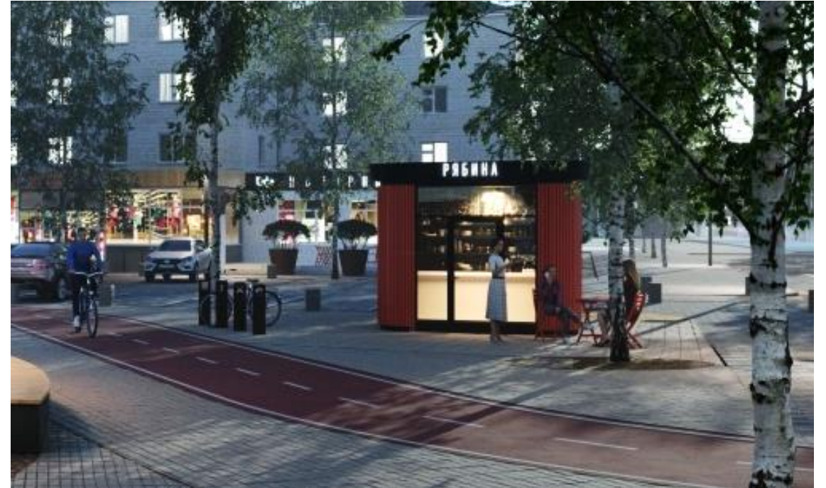
концепт-дизайн места размещения нестационарного торгового объекта в проекте благоустройства «Ковдорский магнит»